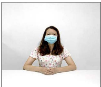
图2：正前方第一机位效果图